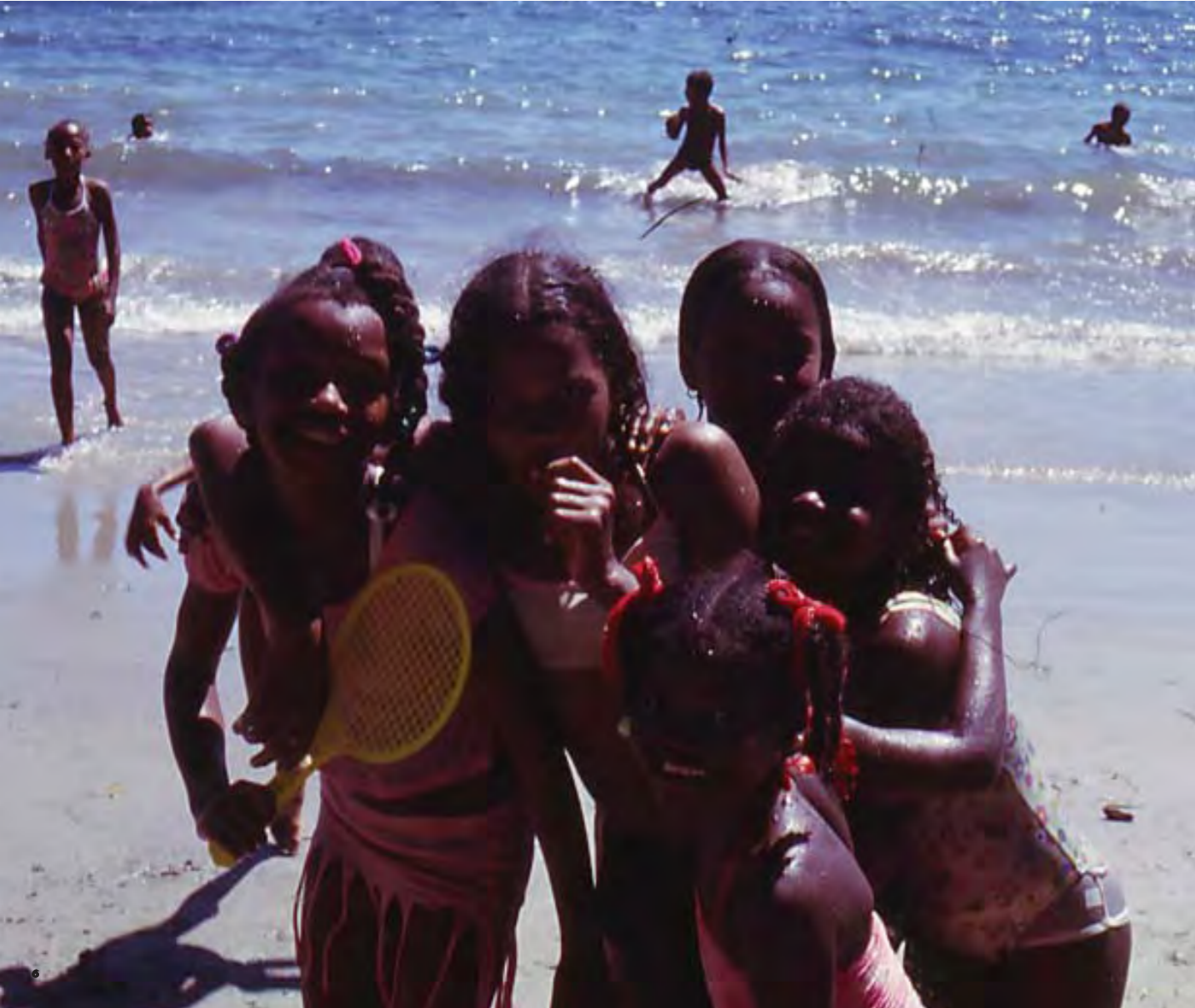
Qui andrebbe la didascalia della foto sopra. Didascalia in inglese qui. Didascalia in spagnolo qui.