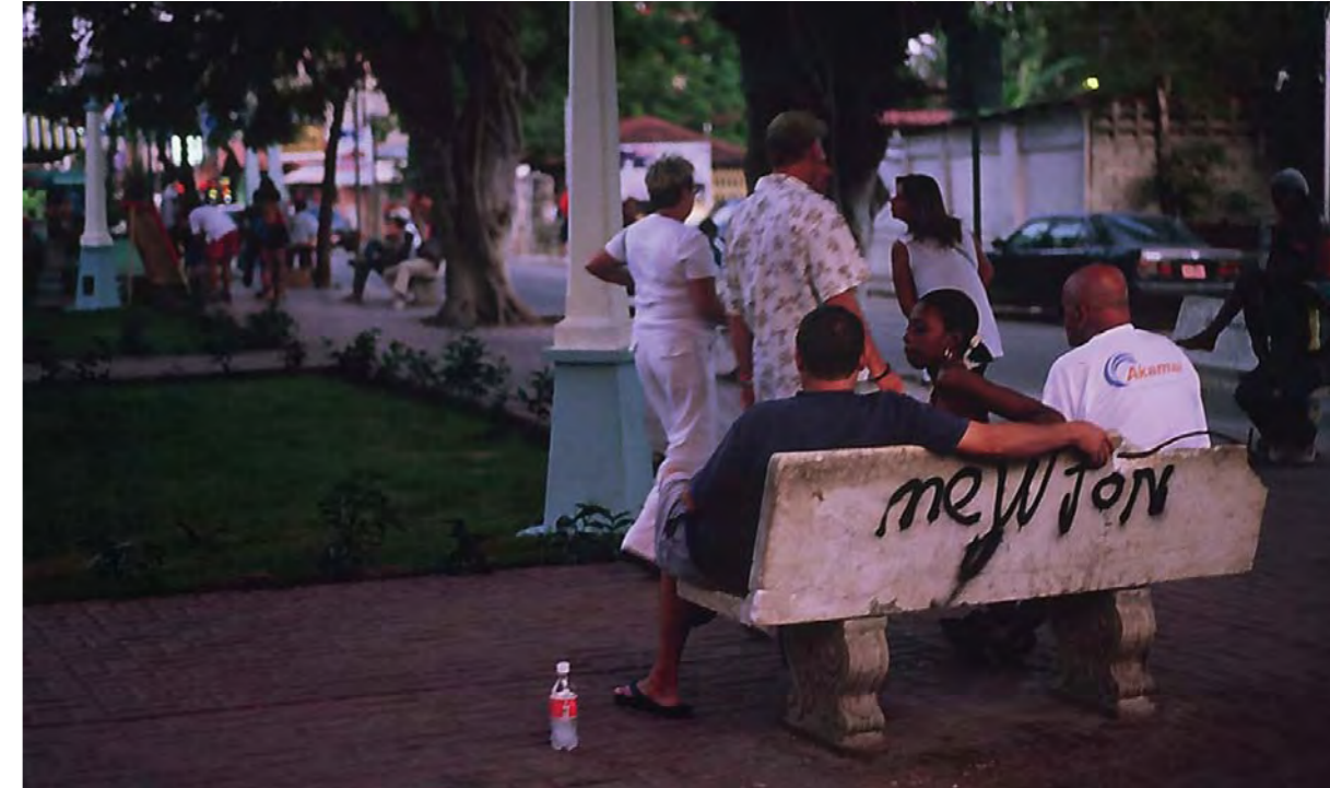
Qui andrebbe la didascalia della foto sopra. Didascalia in inglese qui. Didascalia in spagnolo qui.

Condotta italiano, che ha messo a disposizione una delle sue strutture nel paese, è stato possibile realizzare un "pilot test" sull'efficacia e la percorribilità della fase di implementazione del Codice in un paese di destinazione minacciato dal "turismo sessuale". Tutto questo con il sostegno e la partecipazione delle istituzioni locali.